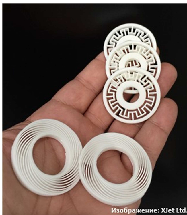
Рис. 4.1. Керамические детали

Примеры узлов, созданных с помощью 3D-печати: