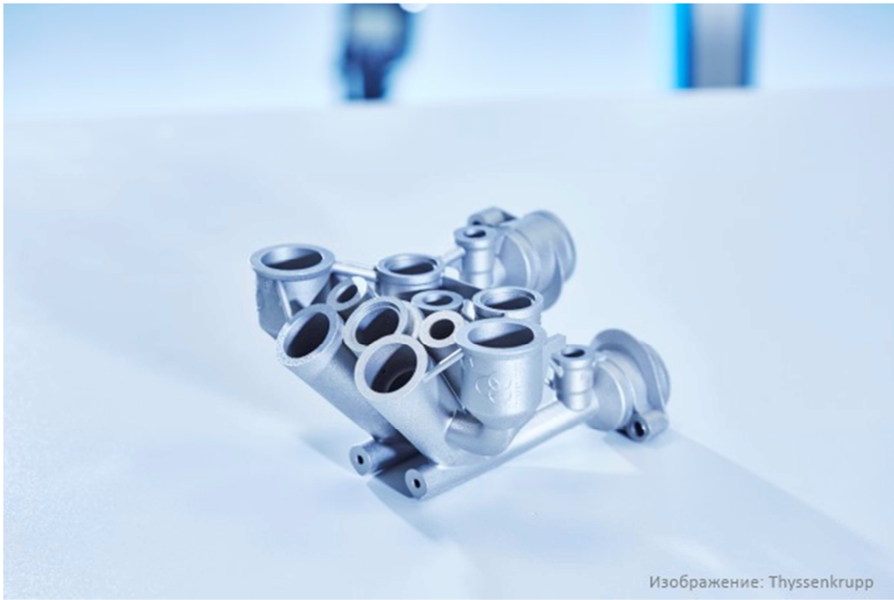
Рис. 4.2. Гидравлический блок из металла, изготовленный на установке 3D-печати EOS M290 в TechCenter Additive Manufacturing компании Thyssenkrupp