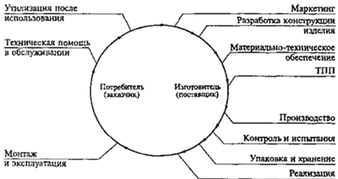
Рис. 3.1. Жизненный цикл изделий [5]

Изделием в машиностроении называют предмет производства, изготавливаемый на предприятии. Жизненный цикл изделия (ЖЦИ) – это совокупность взаимосвязанных процессов создания и последовательного изменения состояния изделия от формирования исходных требований к нему до окончания его эксплуатации или потребления. Каждый из указанных процессов связывают с определенным этапом ЖЦИ (рис. 3.1). [3, 10].